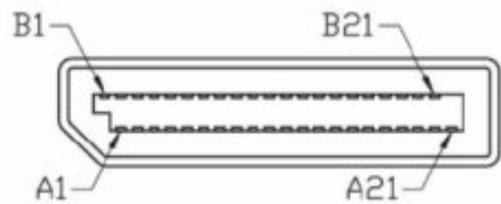
SFF-8612 OCuLink pinout (Output)